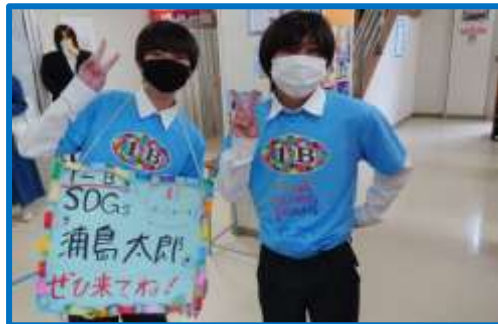
⑭海の豊かさを守ろう