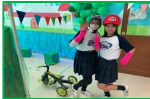
⑮陸の豊かさも守ろう